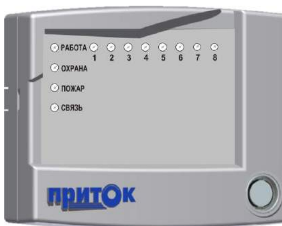
Рисунок 1. Внешний вид прибора

К прибору могут быть подключены устройства, не входящие в комплект поставки: