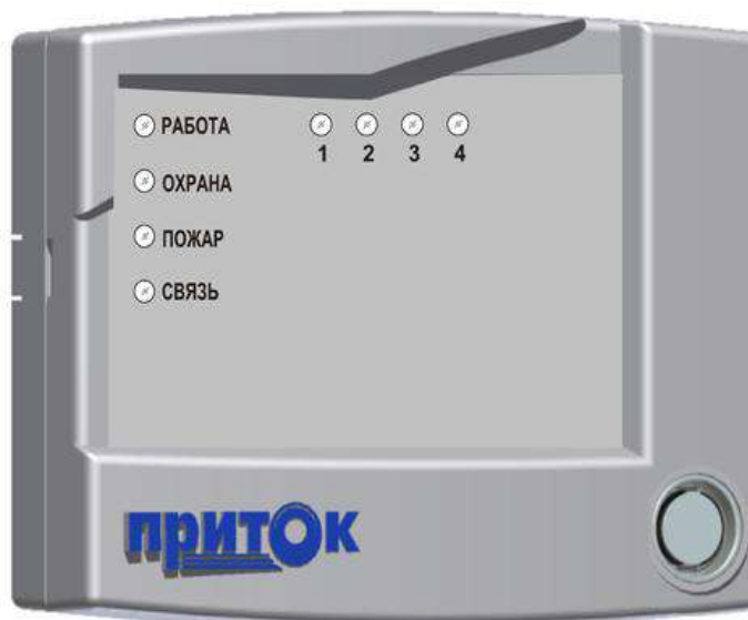
Рисунок 1. Внешний вид прибора

К прибору могут быть подключены устройства, не входящие в комплект поставки: