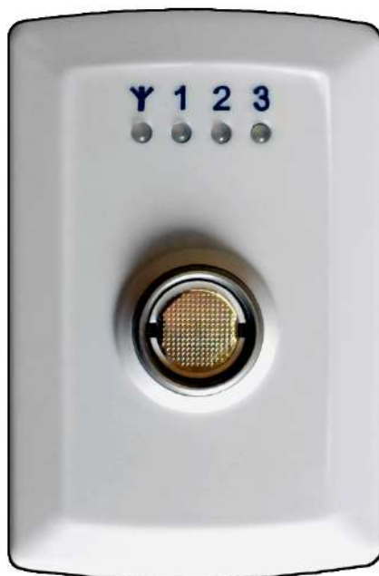
Рисунок 1 – Внешний вид прибора

К прибору через интерфейс Touch Memory (далее по тексту – ТМ ) могут быть подключены устройства, не входящие в комплект поставки: