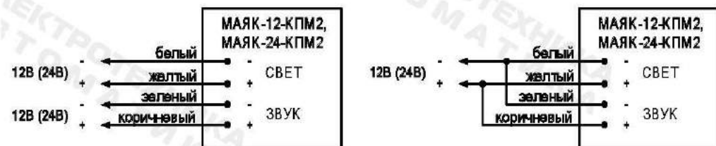
Рис. 1. Схема подключения.

3.3. По окончании монтажа необходимо провести внешний осмотр и убедиться в отсутствии повреждений корпуса и проводов.